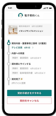
「電子契約くん」入居者 利用画面イメージ