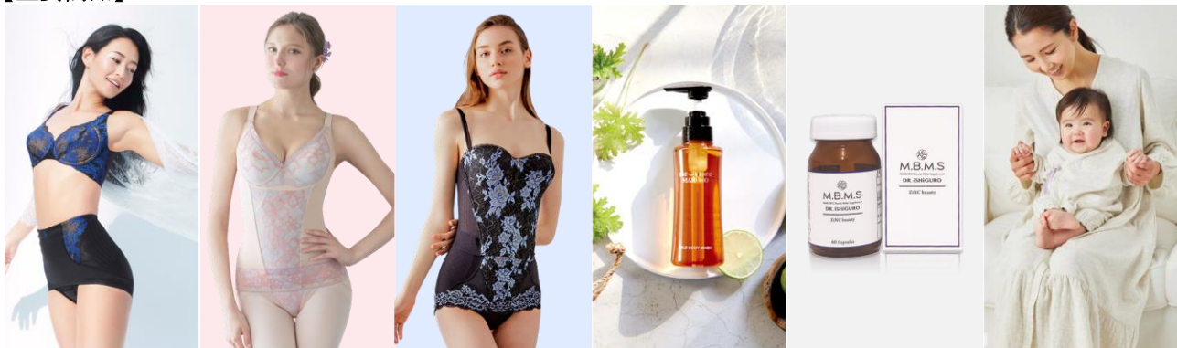
カーヴィシヤス シリーズ