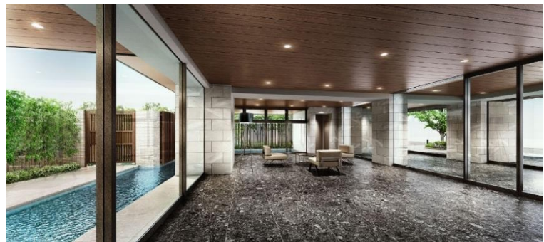
エントランスホール完成予想図 (※3)