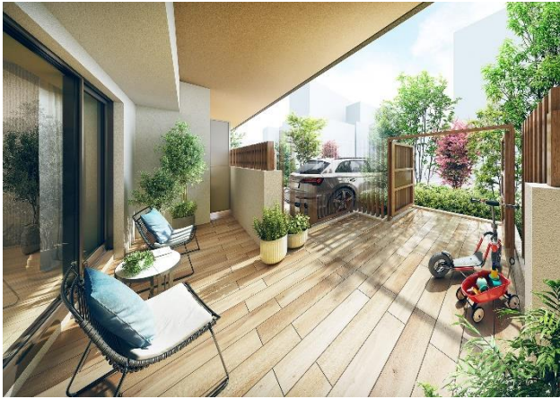
テラス完成予想図 (F2タイプ) (※14)