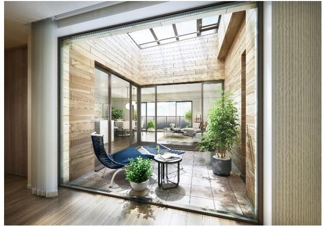
パティオ完成予想図 (Mタイプ) (※14)