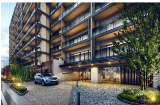
エントランスアプローチ完成予想図 (※3)