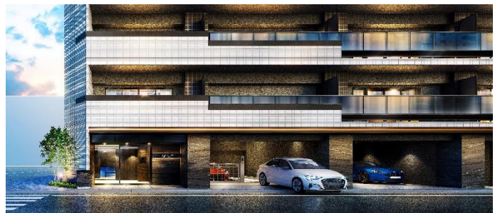
エントランスアプローチ完成予想図（※2）