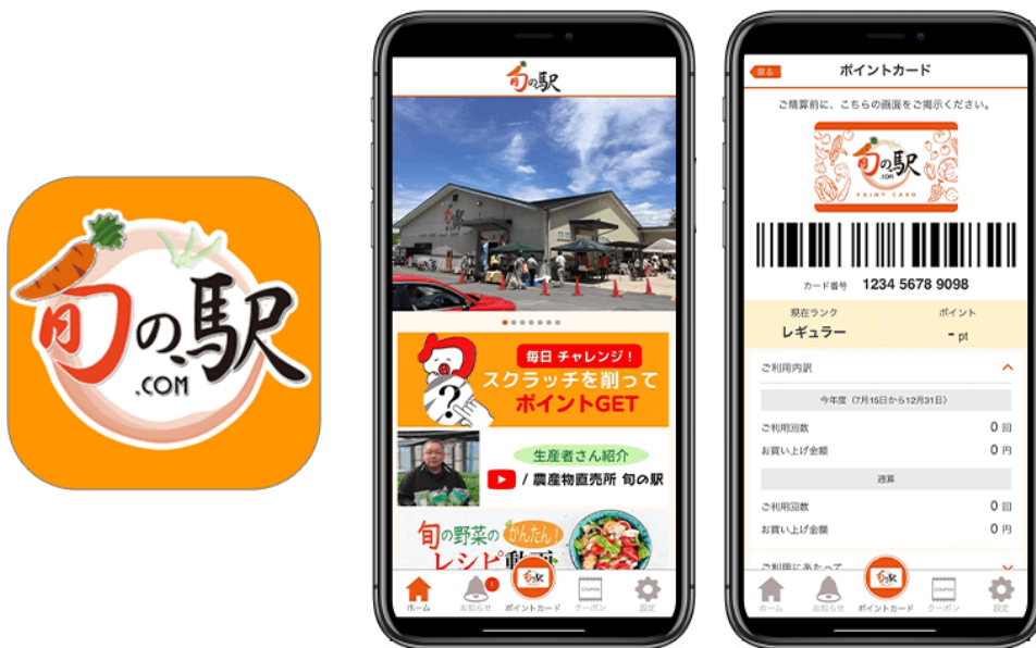
図1 『旬の駅公式アプリ』アイコンとトップ/会員証画面

その他にも、会員限定クーポンや旬の農産物などの最新情報が届き、お店のカテゴリや GPS 等による店舗検索が行えるなど、便利な機能を搭載しています。