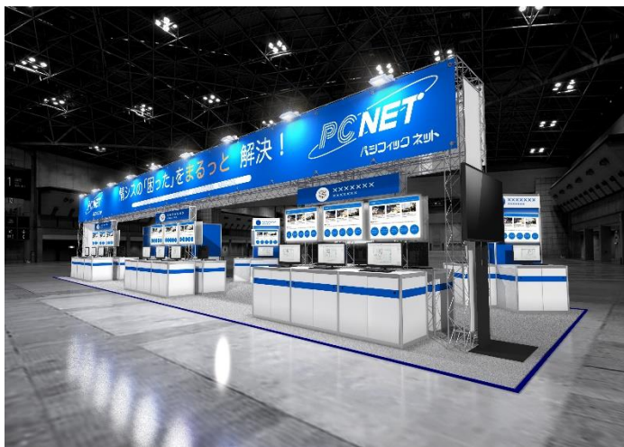
ブースイメージ図 小間番号：40-6（右図レイアウト参照）