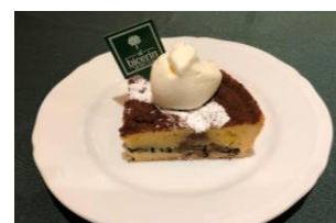
「ビチェリン」栗のタルト

税込み10,000円以上お買い上げのうえ、地下1階「ビチェリン」にて松屋の各種カードとお買い上げのレシートを提示すると、ケーキセット(チョコレートケーキ「サケル」か栗のタルトと、好きなドリンク)を提供します。(先着50名限定)