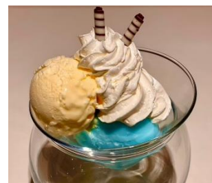
本日のデザートの一例

税込み11,000円以上お買い上げのうえ、8階「MGカフェ」にて阪急メンズ東京の各種カードやアプリとお買い上げのレシート、クーポン発行時にお渡しするサービス券を提示すると、デザートセット(本日のデザートと、コーヒーか紅茶)等を提供します。