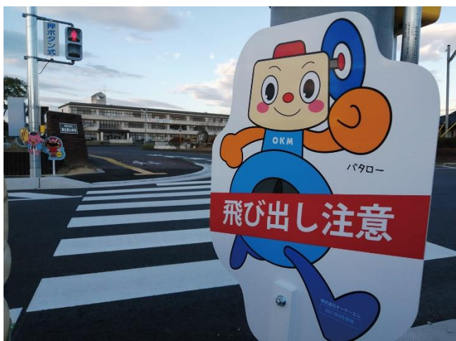
蒲生東小学校前のバタロー飛び出し坊や

1955年頃からの高度経済成長期を迎えた日本では、車の交通量の増加に併せて交通事故死者数が急増し、「交通戦争」と呼ばれる状況にありました。当時、滋賀県では八日市市(現 東近江市)の社会福祉協議会が中心となり交通安全啓発活動の計画が持ち上がりました。1973年、同市内の看板製作者が看板制作の相談を受けて、日本で初めて「飛び出し人形(=飛び出し坊や)」が考案、制作されました。