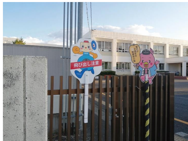
蒲生西小学校前のバタロー飛び出し坊や