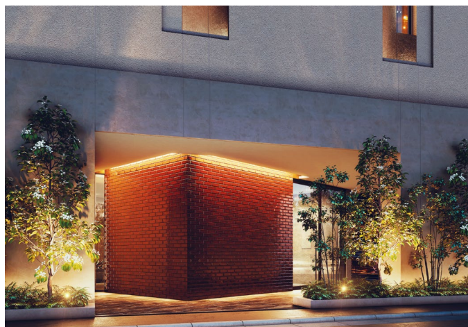
エントランス完成予想図