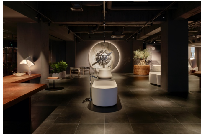
HIDEO ブランド旗艦ショールーム“HIDEO TOKYO”

JAXSON 創業者である清水秀男が 40 年間にわたり培ってきたバスタブデザインと最先端の製造技術、新素材をもって開発した置き型バスタブコレクションを製造販売する会社として 2018 年に設立。