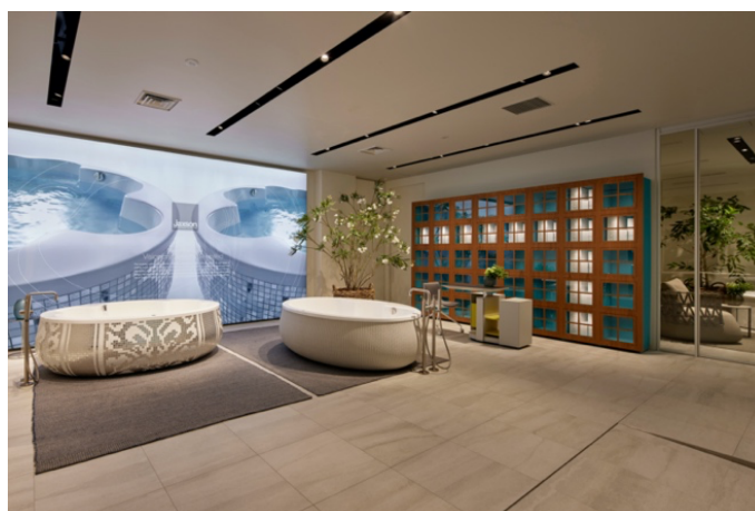
JAXSON ブランド旗艦ショールーム“JAXSON TOKYO”