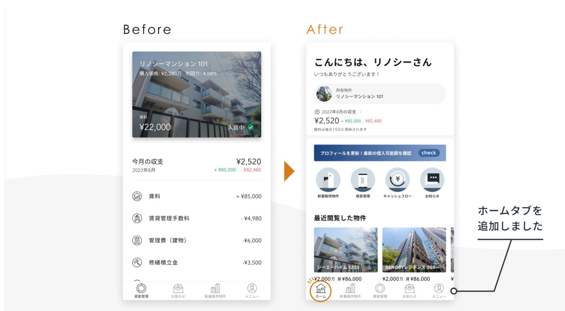
不動産オーナー向けアプリ「OWNER by RENOSY」アップデート前後