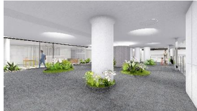
2Fコンセプト： Residence & Water Garden