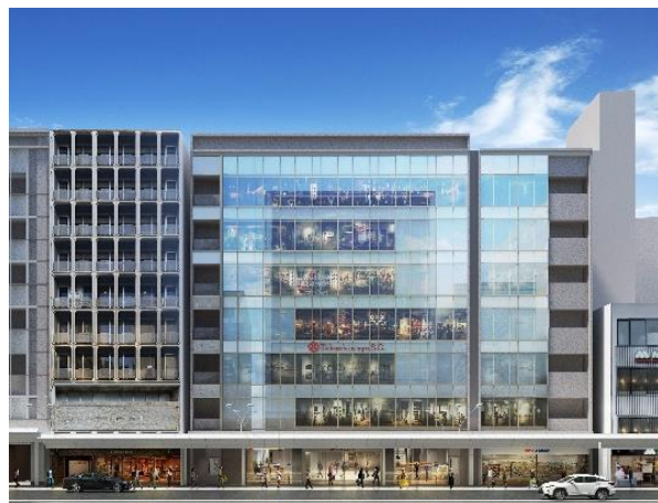
【 京都高島屋 S.C. 専門店ゾーン正面 】