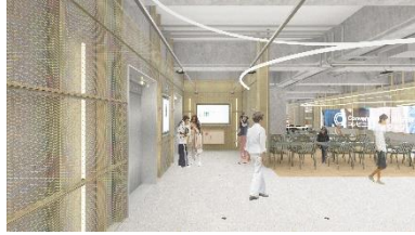
B1Fコンセプト： Convenience & Department Store