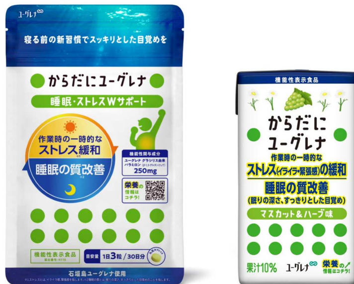
左：「からだにユーグレナ 睡眠・ストレス Wサポート 機能性表示食品」

※1 機能性関与成分「ユーグレナグラシリス由来パラミロン（ \beta -1,3-グルカンとして）」がダブル機能性「作業時の一時的なストレス（イライラ感、緊張感）の緩和」、「睡眠の質（眠りの深さ、すっきりとした目覚め）を改善する機能」に関する機能性表示食品の届出を完了（2021年8月17日） https://www.euglena.jp/news/210817-2/