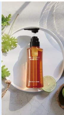
me_more MARUKO シリーズ