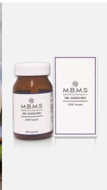
健康食品及び サプリメント