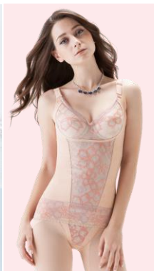
バルアージュアヴァンセ サクテシリーズ