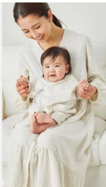
マタニティ& ベビーウェア