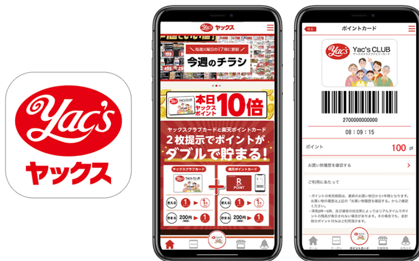
図1 『ヤックスアプリ』アイコンとトップ/会員証画面