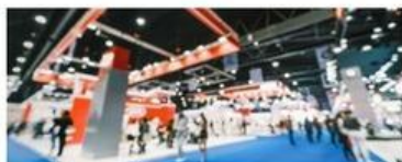
展示会・シンポジウム・フォーラム・採用イベント