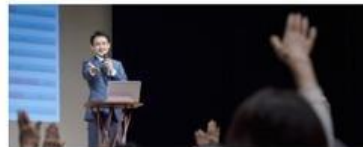
新製品発表会・会見