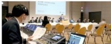
バーチャル株主総会