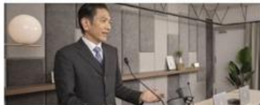
オンライン決算説明会