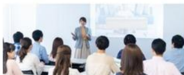
アニバーサリーイベント、入社式・内定式、社内キックオフ