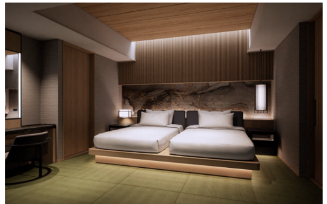
ロイヤルスイート 和タイプ (左:リビングルーム 右:ベッドルーム)