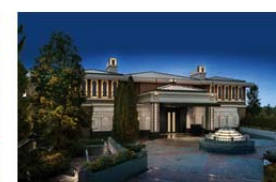
エキシブ六甲 サンクチュアリ・ヴィラ