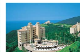
エキシブ鳴門 サンクチュアリ・ヴィラ ドゥーエ