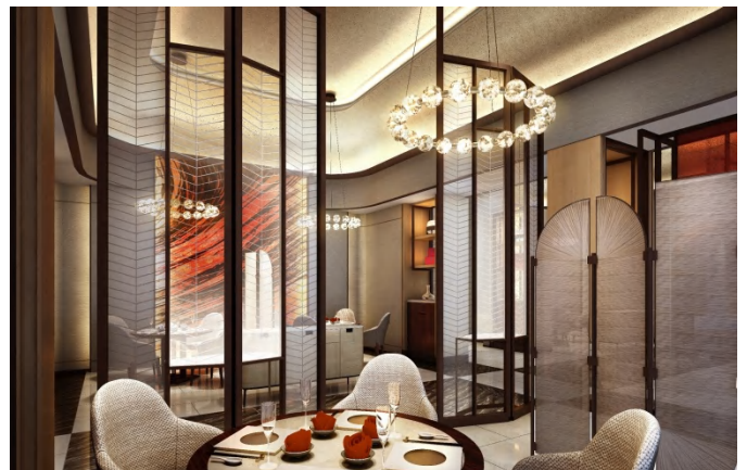
中国料理レストラン