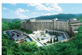
エキシブ有馬離宮