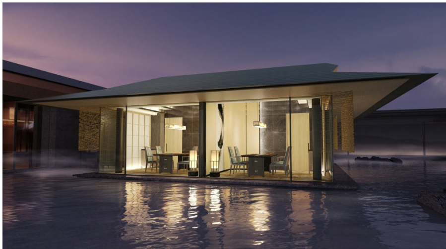
日本料理レストラン 浮殿個室

山の稜線や水の流れをモチーフにしたアートワークとスクリーンを随所に配した、開放感と落ち着きが同居するラグジュアリーな空間。華やかな雰囲気の中、洗練されたチャイニーズをお楽しみください。