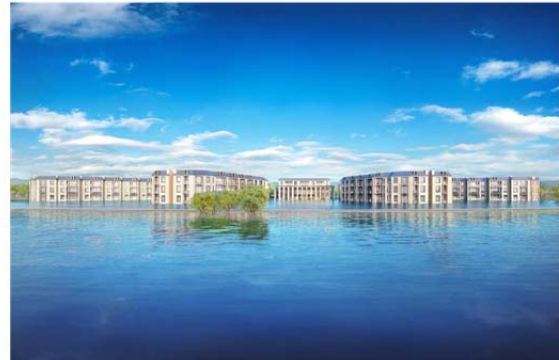
サンクチュアリコート琵琶湖 ベネチアンモダンリゾート（2024年10月開業予定）