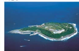
エキシブ初島クラブ