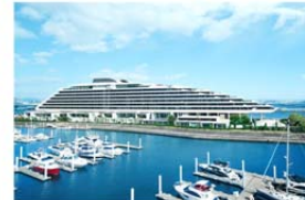
芦屋ベイコート倶楽部