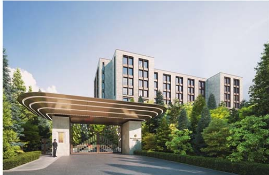
サンクチュアリコート高山 アートギャラリーリゾート（2024年3月開業予定）

交換利用は、サンクチュアリコート2施設（建設中）の他、ベイコート倶楽部4施設、エキシブ26施設が対象です。（発表日現在）※所有部屋グレードによって、交換利用できる施設の範囲は一部異なります。