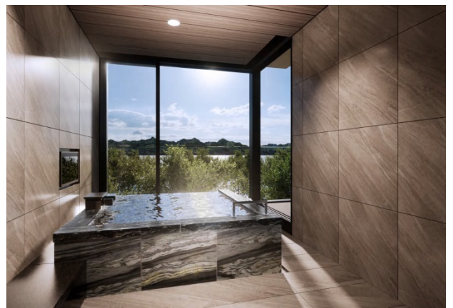
ロイヤルスイート 洋タイプ (左:リビングルーム 右:バスルーム)