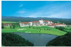
エキシブ那須白河