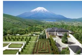
エキシブ山中湖サンクチュアリ・ヴィラ