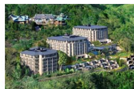
エキシブ箱根離宮