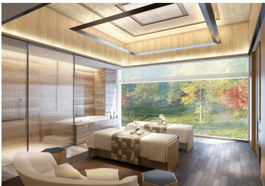
トリートメントルーム