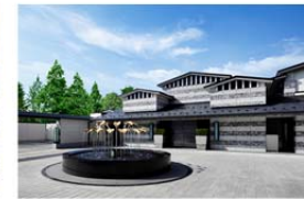
エキシブ軽井沢サンクチュアリ・ヴィラ ムゼオ