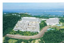
エキシブ白浜&アネックス