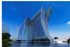
横浜ベイコート倶楽部