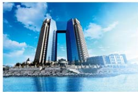
東京ベイコート倶楽部