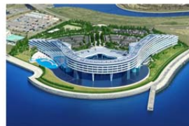
ラグーナベイコート倶楽部