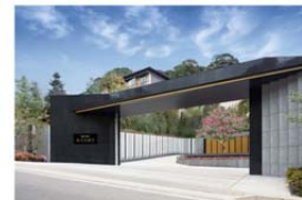
エキシブ湯河原離宮