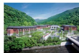
エキシブ京都 八瀬離宮