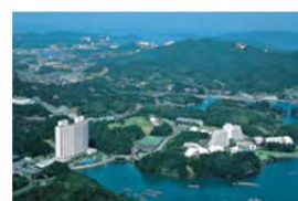
エキシブ鳥羽&アネックス