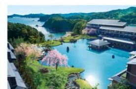
エキシブ鳥羽別邸