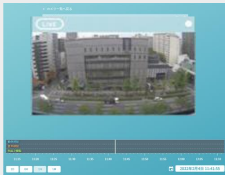
ライブ・録画閲覧画面