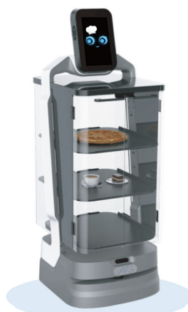
配膳ボックス装着時