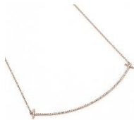
ティファニー Tスマイル ペンダント