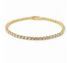
カルティエ ダイヤモンド テニスブレスレット