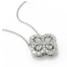
ハリーウィンストン ループ・フルモチーフ・ペンダント