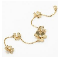
Van Cleef & Arpels フリヴォール ブレスレット 5 フラワー