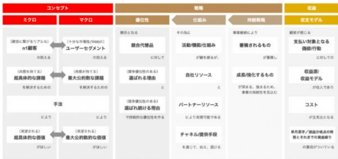
事業構想の「CHECK」のためのフレームワーク

「バリューデザイン・シンタックス」は、ビジネスモデルを構成する要素を分解し、ひとつの構文として表現しています。フレームワークに沿って事業構想を文章化することで、全体像が可視化され構成要素の整合性や弱点を簡単に把握できます。