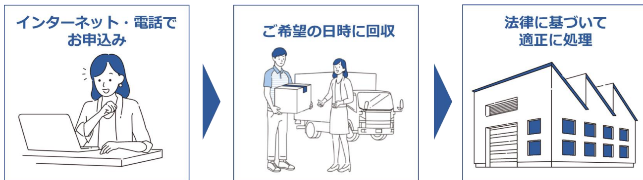
ご利用方法イメージ

今後も両社は自治体との連携を強化し、不法投棄の抑制やリサイクルの促進を図ることで、持続可能な循環型社会の実現に貢献してまいります。