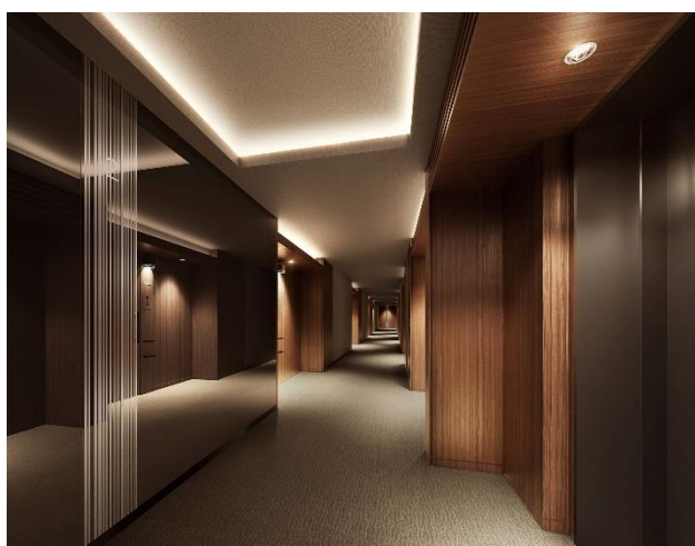
内廊下完成予想図（※2）