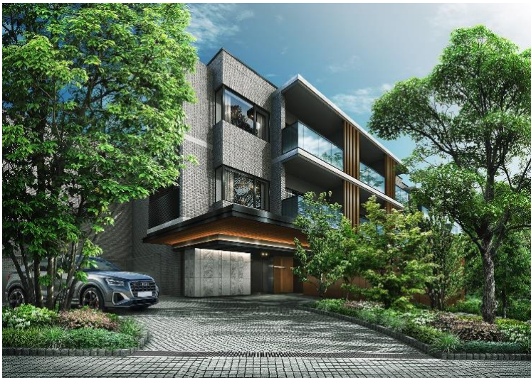
エントランス完成予想図(※2)

「クリオ世田谷松原ザ・クラシック」は、東急世田谷線「松原」駅・「山下」駅、京王井の頭線「東松原」駅のほか、小田急小田原線の「豪徳寺」駅・「梅ヶ丘」駅、さらには複数路線が乗り入れる京王線「明大前」駅、「下高井戸」駅の7駅4路線が利用可能な利便性に優れたポジションに誕生します。現地は穏やかな住環境が守られる第一種低層住居専用地域にあり、周辺は成熟した街並みが広がっています。徒歩圏内に生活利便施設や「羽根木公園(徒歩10分)」をはじめとする大小の公園があり、四季折々の自然が身近な環境にあります。住戸は総戸数46戸、ルーフトラス付きやメゾネットタイプの100㎡超のプレミアムプランを設けるなど、1LDK~3LDKの多彩な間取りと機能的の共用施設を備えた低層邸宅を計画しています。