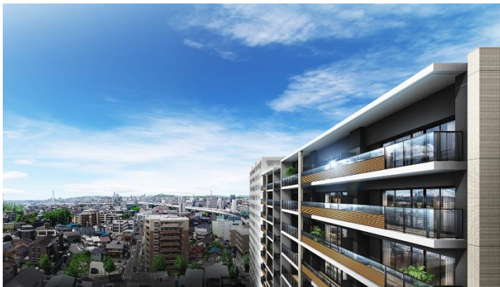
眺望外観完成予想図 (※6)