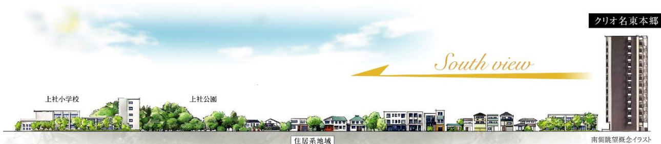
南側眺望概念イラスト（※2）