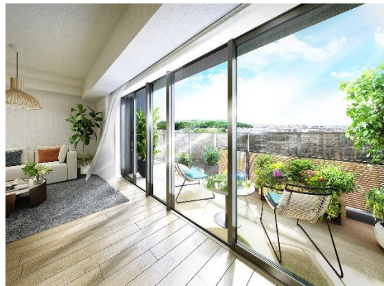
リビング・ダイニング完成予想図 Fタイプ (※6)