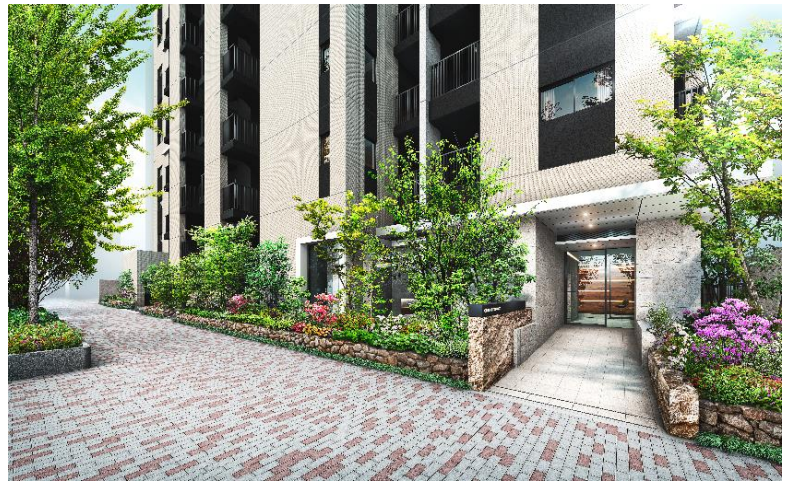
エントランス完成予想図（※1）