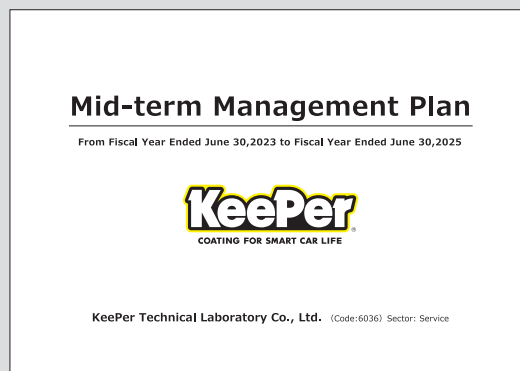
※中期経営計画 2023年6月期～2025年6月期 英語版