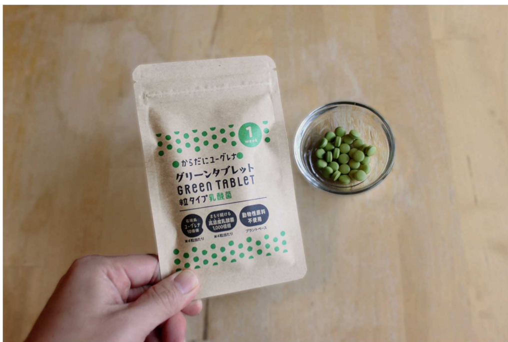
「からだにユーグレナ グリーンタブレット乳酸菌 動物性原料不使用」商品イメージ

※1 ユーグレナグループのフレンバシー社が運営する、ソーシャルグッドな商品をお届けするマーケットプレイス( https://goodgoodmart.com/ )。Good Good Martでの販売は11月上旬からを予定しています