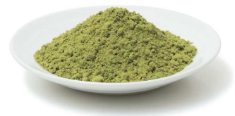
石垣島ユーグレナ粉末

※3 ユーグレナ特有の成分であり、グルコース分子が \beta -1,3-結合により直鎖状に重合した多糖体