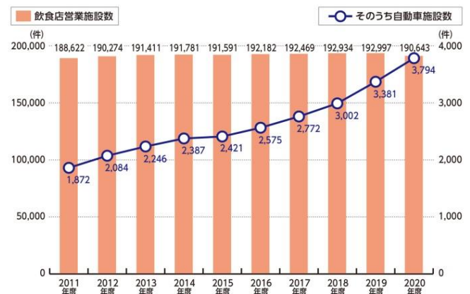
図1. 東京都の飲食店営業施設数と「自動車」施設数の推移

増加の背景には飲食店や物販などの新規販路開拓としてのニーズの高まりが一因として考えられます。東京都福祉保健局の「食品衛生関係事業報告」によると、東京都の「飲食店営業の自動車数」は2011年度の1,872件から2020年度の3,794件と約2倍、2019年、2020年のコロナ渦で伸び率がさらに高くなっています（図1）。