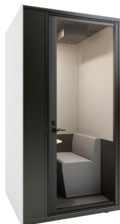
スタンダードタイプ