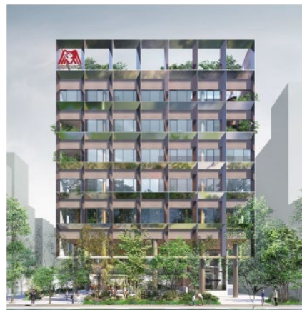
(仮称) 森永製菓芝浦ビルの 外観イメージ