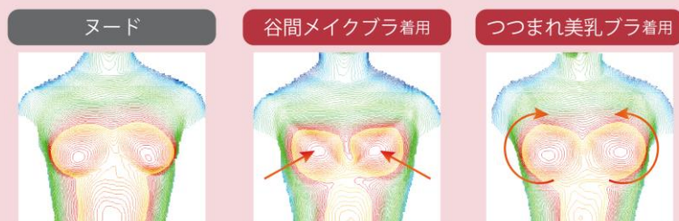
ヌード バストが横に広がり垂れている。