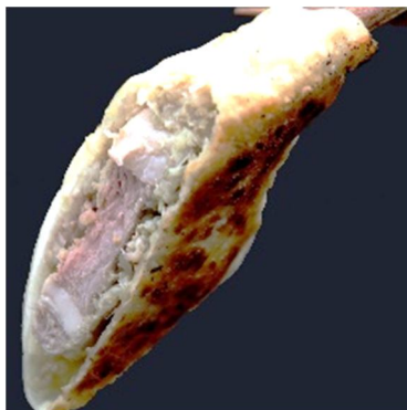
骨付きラム肉が、そのまま餃子に 商品名：北海道ラムチョップ 大粒餃子 内容量：130g×3 粒 価格：3,240 円（税込・送料別）