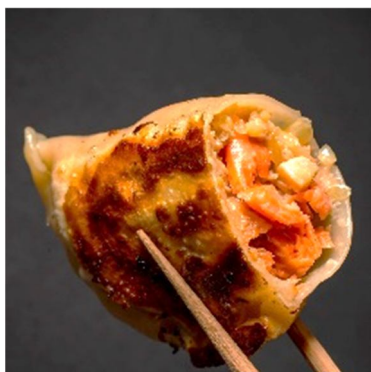
旬の鮭と、チーズの旨味が調和 商品名：鮭と北海道チーズの大粒餃子 内容量：60g×5 粒 価格：1,728 円（税込・送料別）