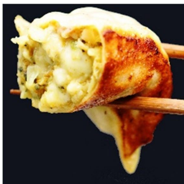
カレー×チーズのマリアージュ 商品名：北海道カレーチーズ 大粒餃子 内容量：60g×5 粒 価格：1,404 円（税込・送料別）