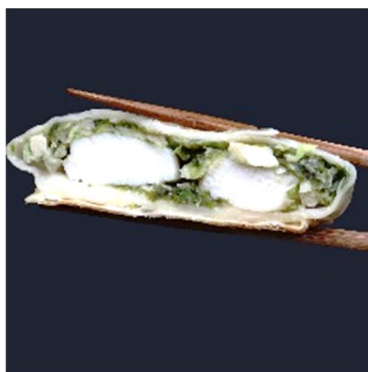
食べ応え抜群の帆立が丸々2 粒 商品名：まるまる帆立 棒餃子 内容量：80g×3 粒 価格：3,240 円（税込・送料別）