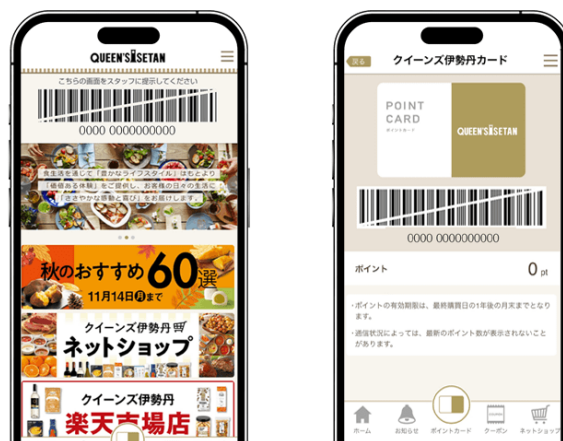
図1 『クイーンズ伊勢丹公式アプリ』トップ/ポイントカード画面イメージ