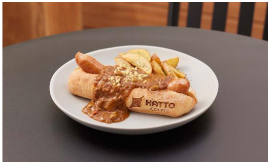
▲こぼれキーマカレードッグ