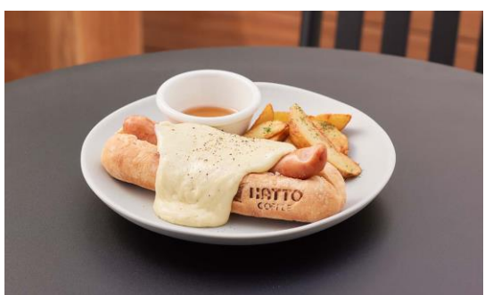
▲クワトロフォルマッジドッグ