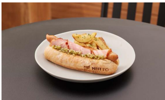
▲ベーコンラップドッグ