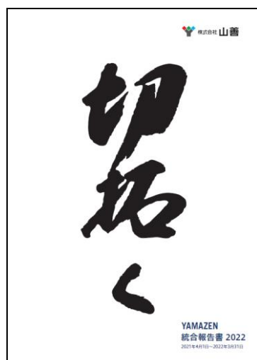
表紙：経営理念の一つである「切拓く」

今後も当社グループへのご理解を深めていただけるよう、開示内容の充実を図るとともに、投資家の皆様をはじめとするステークホルダーの皆様との建設的な対話を行い、さらなる企業価値の向上に努めてまいります。