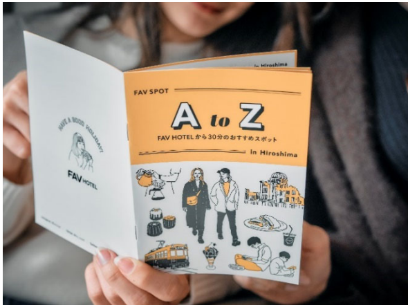
(「FAV SPOT AtoZ BOOK」イメージ)

(2) スマートフォンの画面など 8000 歩以上歩いたことが証明できるものをご提示ください。