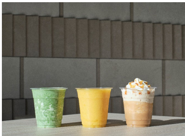
(左：スムージーイメージ、右：1F カフェスペース)