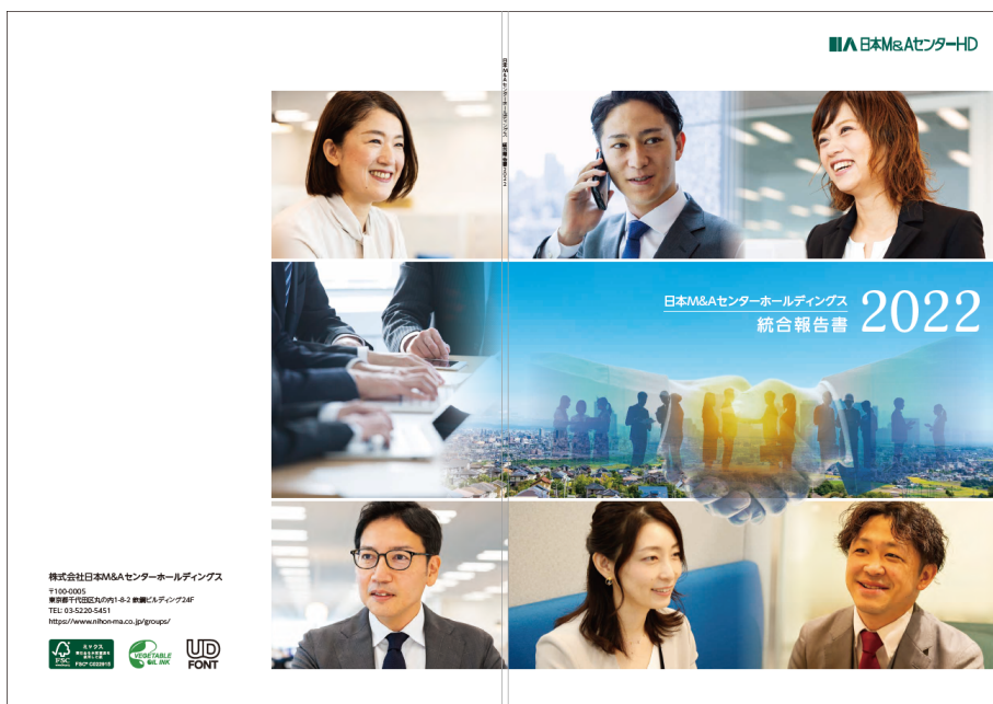
統合報告書「日本M&Aセンターホールディングス 統合報告書 2022」表紙