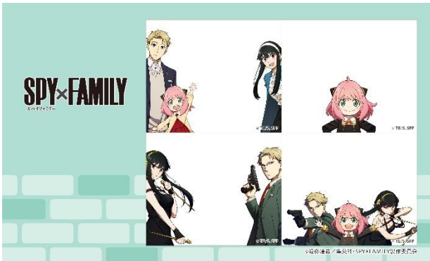
フォージャー家セット