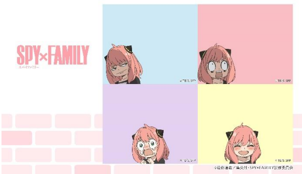
いろいろアーニャセット