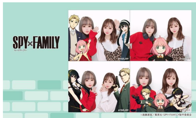
「SPY×FAMILY」のプリコラボは撮影フレームに 合わせてポーズをとるのがおすすめ

「SPY×FAMILY」とは、「少年ジャンプ+」(集英社)にて連載中の累計発行部数2,700万部を突破する遠藤達哉氏による人気漫画作品です。より良き世界のため諜報任務にあたっている凄腕スパイ“黄昏”が、新たな任務のために仮初めの家族をつくることに。その特殊な家族が繰り広げる、スパイコメディです。4月にはTVアニメ第1期を放送。10月からは第2期の放送が開始した話題の作品です。