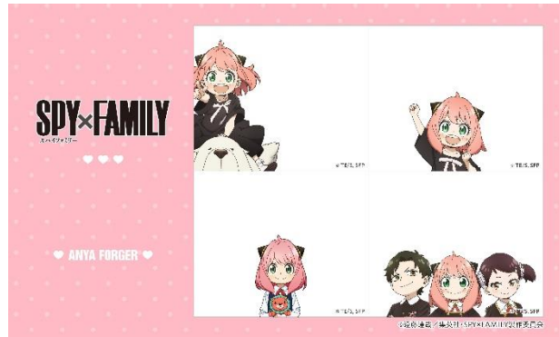
アーニャといっしょ！セット