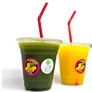
ユーグレナ&ティダパイン®果汁 100%ジュース（手前）