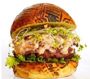
セントオブぬちぐすいバーガー

特注のほんのりと甘い石垣島ユーグレナ入りのバンズに、石垣島など八重山郡内で生産されたブランド牛「石垣牛」のパティと、モzzarellaチーズとブルーチーズを合わせてトリュフオイルで香りをつけたイナムルチ味噌きのこソースに、自家製青パイヤピクルスとたっぷりの野菜を合わせました。「島ぐるめアワード2022」の出品商品です。