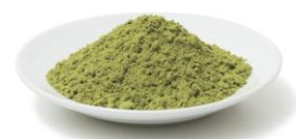
石垣島ユーグレナ粉末

※3 ユーグレナ特有の成分であり、グルコース分子が \beta -1,3-結合により直鎖状に重合した多糖体