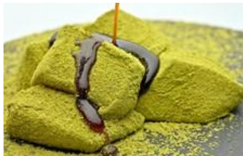
楽園のわらびムーチャー ユーグレナ抹茶味

創業 150 年を誇る老舗和菓子店「芭蕉堂」の名物わらび餅に、石垣島ユーグレナをブレンドし深みのある香ばしい抹茶きな粉をまぶしました。味わい深いユーグレナ抹茶きな粉がプルプル食感のわらび餅を引き立てています。「第 4 回ジャパン・サステナブルシーフード・アワード」ファイナリスト選出の際の協力企業コラボ商品です。