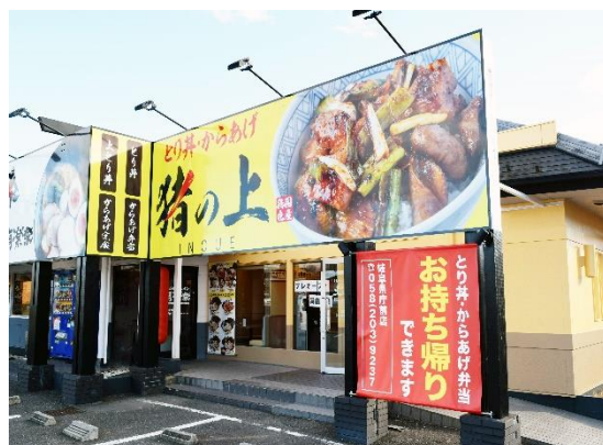
「 いのうえ 猪の上」店舗外観