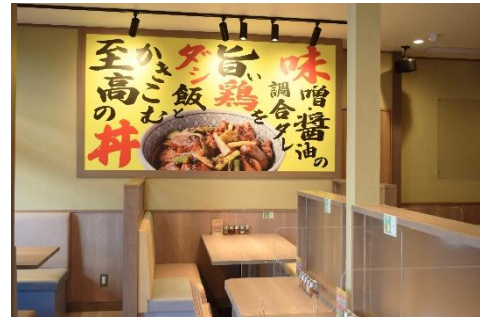
いのうえ 「猪の上」店舗内観