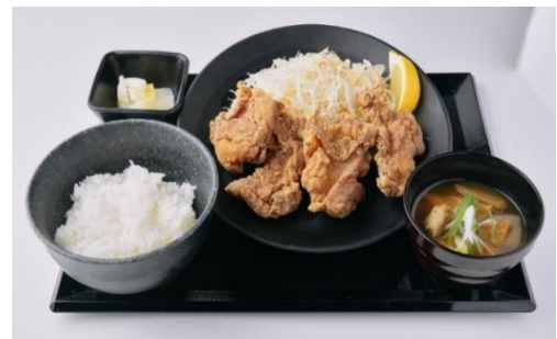
レモン塩からあげ定食・とり味噌汁付 780円（税込）