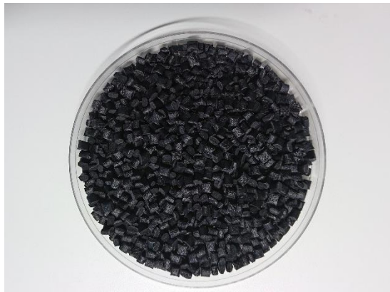
【インテークマニホールドを原料とした再生ナイロン樹脂 REAMIDE®】

なお、この「REAMIDE®」新グレードについては、12月7日(水)～9日(金)に幕張メッセで開催される「サステナブルマテリアル展」でのリファインバースブースにてご紹介いたします。