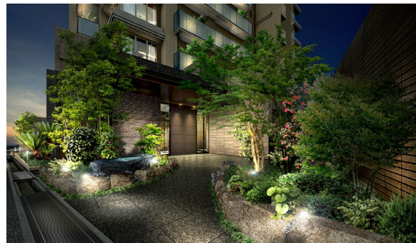
エントランスアプローチ完成予想図