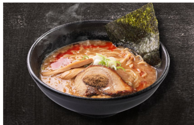
濃厚煮干しラーメン