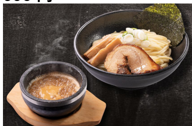
石焼濃厚つけ (並盛)