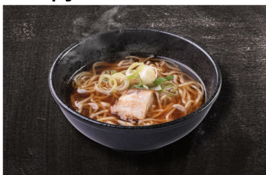
おこさまラーメン