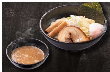
温玉濃厚つけ (並盛)