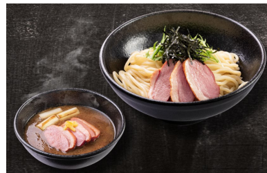
鴨せいろつけ麺 (並盛)