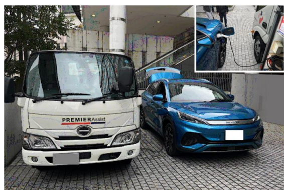
EV 駆けつけ充電のイメージ