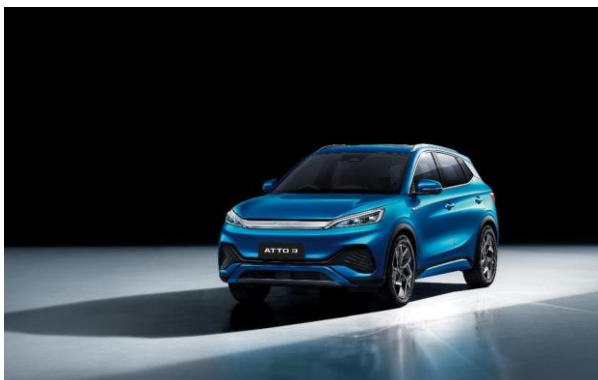
BYD の e-SUV「ATTO 3」（2023年1月販売開始）