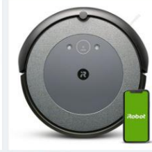
<アイロボット> ロボット掃除機 ルンバ i3 i315060