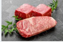
<米沢牛真木> 米沢牛塊ステーキ ロース1塊550g、モモ肉2塊 (計1200g)