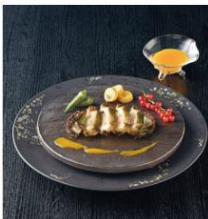
<日本のおいしいお料理> 日本料理店の天然あわびステーキ 70g×3個