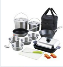
<ピタクラフト> アウトドアビギナーズセット