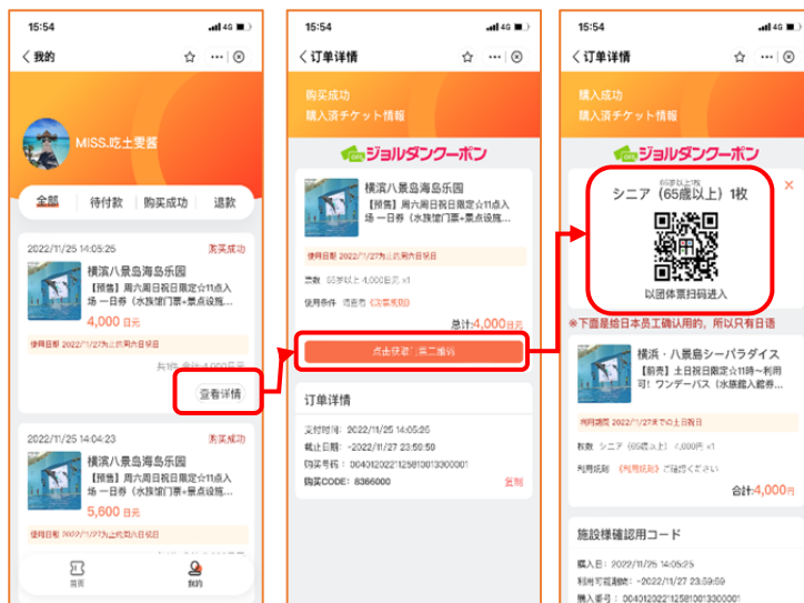
ワンデーパスの利用イメージ