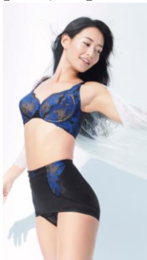
カーヴィシャス シリーズ