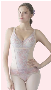
ベルアージュアヴァンセ サクテシリーズ