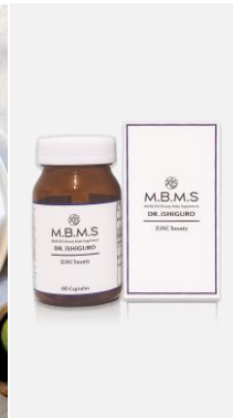
健康食品及び サプリメント