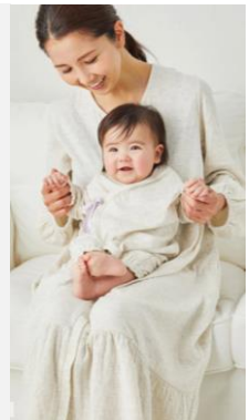
マタニティ& ベビーウェア