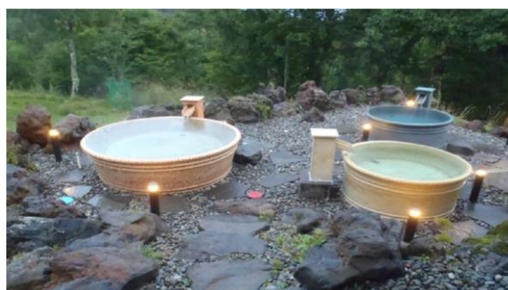
【写真：混浴が行われた露天風呂】

ルディングスから提供を受けた資料によれば、招待客に女性が含まれていない場合の VILLA 蓼科の利用回数は約 60 回であり、うち、女性出張コンパニオンを手配した回数は約 44 回である。)、女性出張コンパニオンを手配した場合には、おおむね毎回、以下の露天風呂において、おおむね男性はタオルで局部を隠し、女性は以下の写真の湯あみを着用した状態で、混浴を実施していたことが認められた(ただし、当該混浴が行われた日に VILLA 蓼科を利用していた者全員が混浴に参加していたわけではなく、寝室に戻っていたりビリヤードや飲食をしていたりする等、別行動を行っていた者がいることも認められた。))。