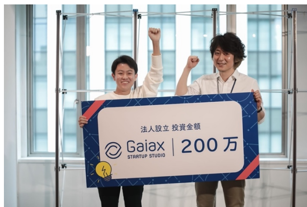
ドルトン東京学園との起業ゼミの様子