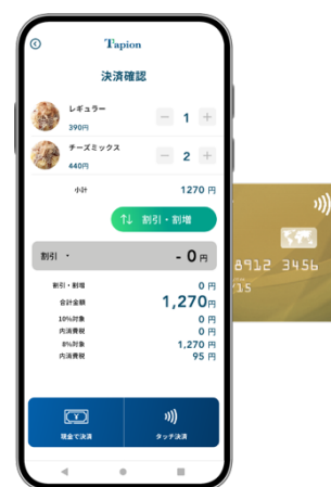
Tapion 決済画面イメージ

フライトシステムでは今後の本格展開に向け、今回のパイロット運用を通じ機能改善を行なっていくと共に、「Tapion」でキャッシュレス決済、及びタッチ決済の普及拡大に努めて参ります。