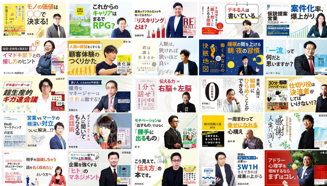
約 300 冊ものビジネス書解説動画を公開中

従来のbizplayの動画プラットフォームや当社の強みであるデジタルマーケティングを活用し、ビジネス力を高めたいユーザーの体験価値を高め、書籍が売れにくくなっている時代において、書籍の「売れる仕組み」を構築することで、出版社、著者、書店のお力になれるように努めてまいります。